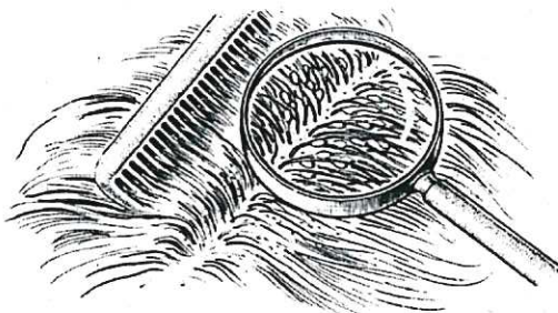
Nissen nahe der Kopfhaut

Wir bitten Sie, die Haare Ihres Kindes gründlich auf das Vorhandensein von Kopfläusen zu untersuchen. Am besten scheiteln Sie das Haar mit einem feinen Kamm und suchen unter guter Beleuchtung streifenweise die Kopfhaut und den Kamm mit einer Lupe ab. Besonders gründlich sollten Sie die Stellen an der Schläfe, um die Ohren und im Nacken nachsehen.